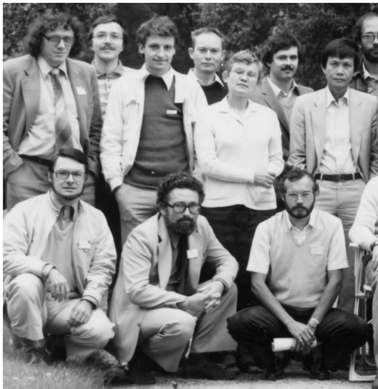
Ecole d'été d'Analyse Numérique, Le Bréau sans nappe, juillet 1980