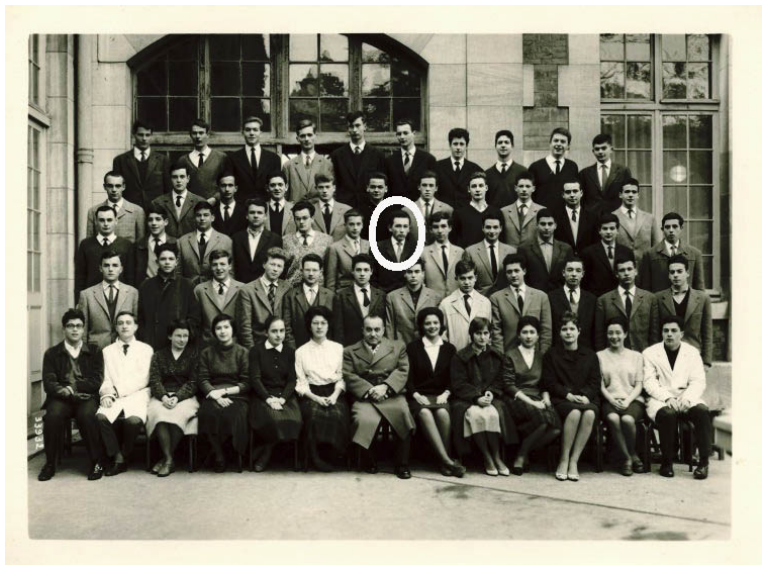
Lycée Janson de Sailly, Math. Sup., (1960)