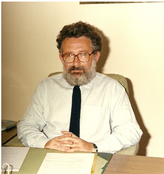
Centre de Limeil, Département de Mathématiques Appliquées