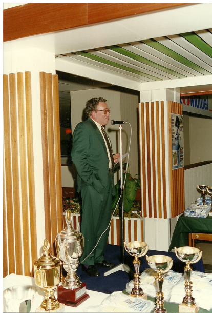
Directeur du centre de Limeil-Valenton