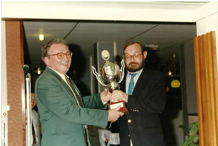
Directeur du centre de Limeil–Valenton, remise de prix sportifs !